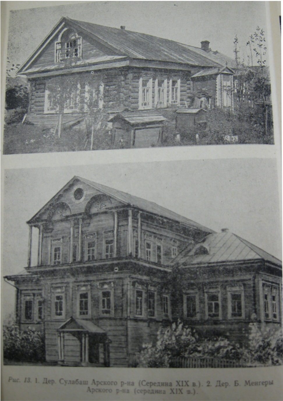
Ф.Х. Валеев Архитектурно-декоративное искусство казанских татар Сельское жилище Марийское книжное издательство Йошкар-Ола 1975г.

Аналоги дощатых и открытых крылец с фронтонами и двускатными кровлями.